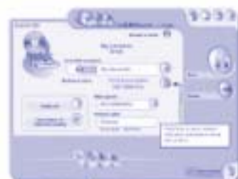
IbmCDMaker – Programa para gravação de imagens em CD ou DVD.

VANTAGEM COMPETITIVA: O módulo SENDER (permite selecionar, ajustar, corrigir e preparar as imagens para impressão) pode ser instalado em uma rede de computadores (no balcão da loja, por exemplo). Enquanto os nossos concorrentes cobram por cópias de softwares instaladas, nós oferecemos um sistema aberto para diversos usuários, sem restrições e sem custo adicional .