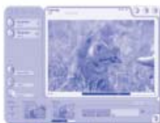
IbmLab – Controle as funções do seu minilab, calibrações e o processo final de imagem.